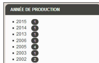
Vos productions par année